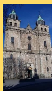
Cathédrale de Malmedy