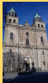
Cathédrale de Malmedy