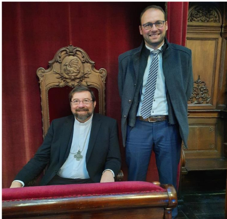
Cathédrale de Malmedy