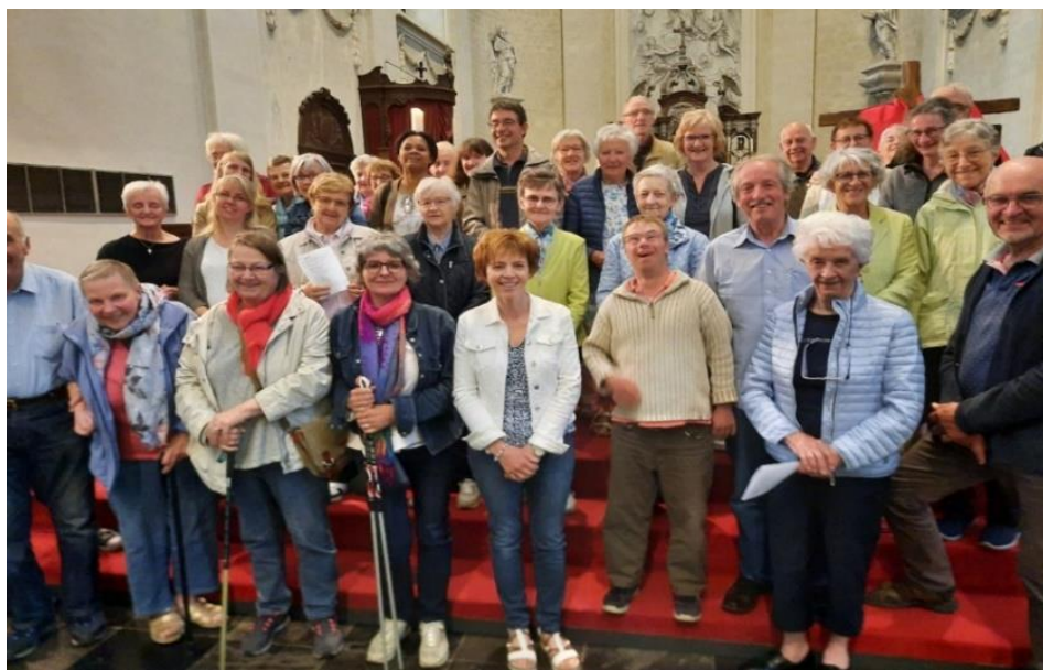
Quelques-uns des participants à la semaine du Cénacle de juin 2022