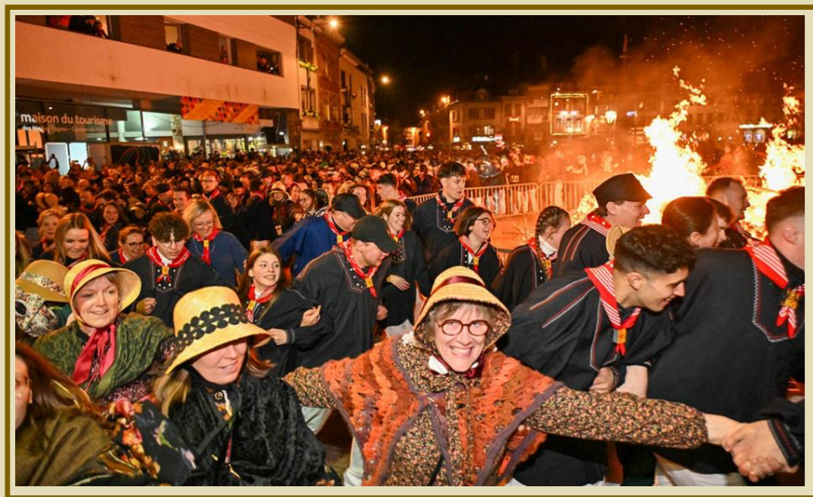
Bûcher de la Haguète 2024

Le Cwarmê de Malmedy est un vrai liant évangélique qui commence le samedi du Trouv'lê et se termine par la soirée de folie du mardi gras autour du bûcher de la Haguète : Â r'vèy Haguète !