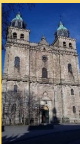
Cathédrale de Malmedy