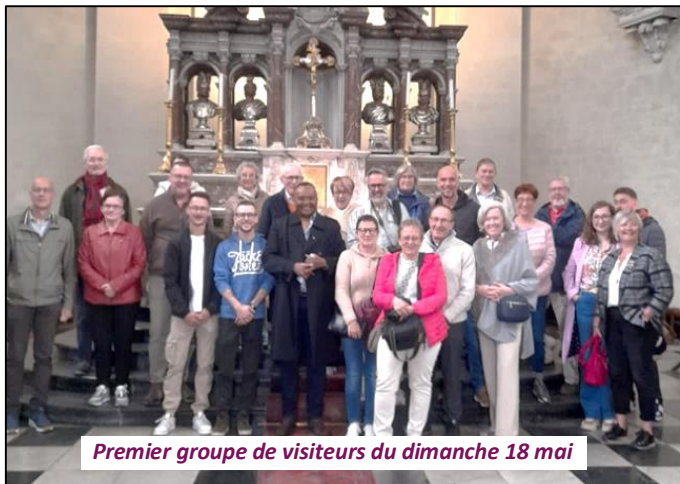
Premier groupe de visiteurs du dimanche 18 mai

Chers amis, dans le cadre de l'Année Sainte 2025, une exposition est organisée dans la bibliothèque communale de Malmedy. Des vitrines regroupant des œuvres et des objets de la Cathédrale s'offrent au