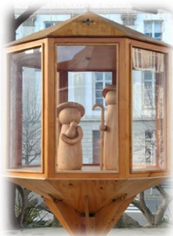
Crèche de la Place de Rome

autour de l'esplanade du Malmundarium avec sa patinoire, et la parade féerique du 21 décembre dernier. Des chars lumineux ont défilé accompagnés de danseuses au son et au rythme des sociétés musicales. Le but de ces festivités, c'est de célébrer Noël ensemble dans la cité de Malmedy.