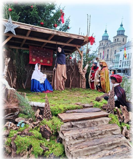
Crèche de la Place Albert 1 er

Dans la ville de Malmedy, pour mettre la fête de Noël en exergue, 27 crèches garnissent quelques points saillants de la cité, réparties en 3 circuits. L'exposition de ces crèches durera jusqu'à ce 4 janvier. Sans oublier le marché de Noël