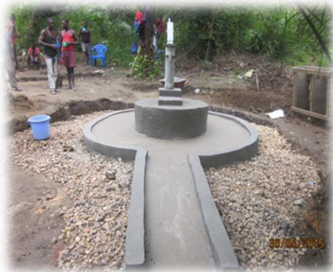
L'eau potable arrive à Niolo !