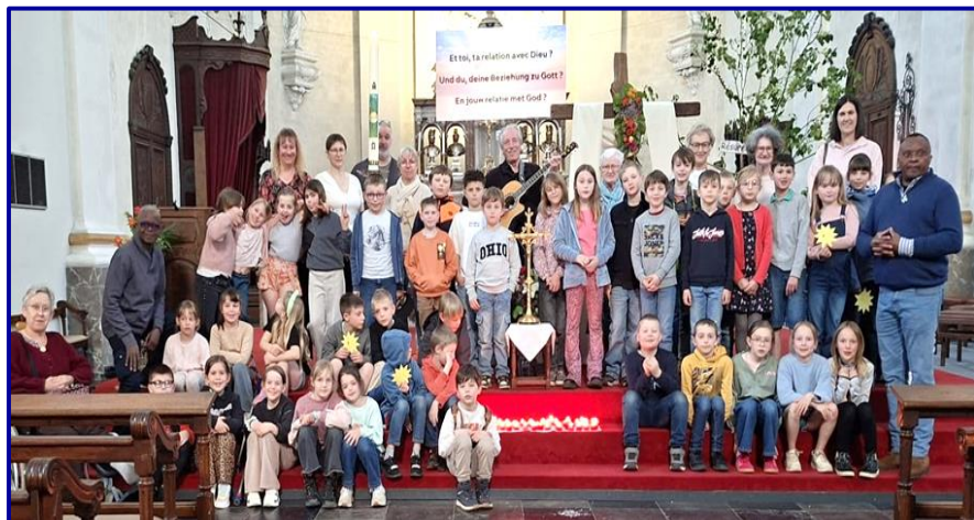
Jour du sacrement du pardon et de la réconciliation

Dans toutes les cultures, le pain, fruit du travail des hommes, est symbole de vie, de partage, de fraternité et de respect de ce que l'on mange. C'est pourquoi on mange sain, à la même table et surtout on évite de gaspiller. De même que notre corps ne peut vivre sans nourriture et sans boisson, spirituellement parlant, nous chrétiens, avons besoin de la communion avec le Christ, pour tenir la route. Jésus le dit sans détour : "Je suis le pain de vie" (Jean 6, 35). Celui qui croque, mâche le petit morceau de pain consacré, l'assimile et reçoit la vie divine, la grâce, la force du Dieu trinitaire. Le plus fou des mystères, n'est-ce pas celui-là : la présence de Dieu en nous ?... Les enfants ont suivi 2 ans de catéchèse pour se préparer à leur 1 ère Communion