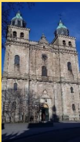
Cathédrale de Malmedy